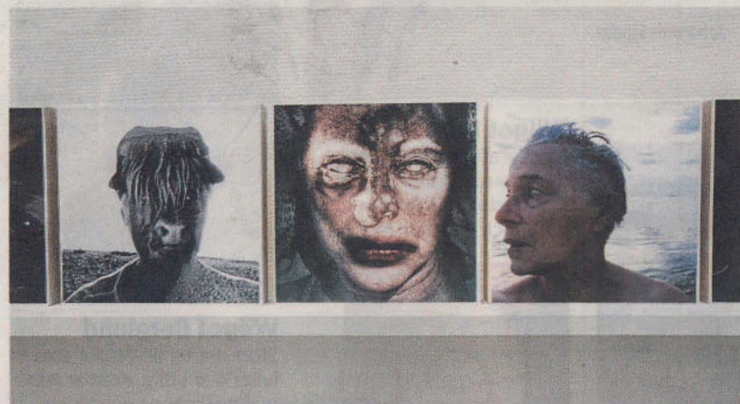
Verk av Lisa W Carlson.